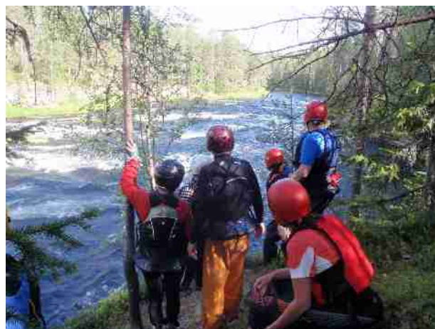
Kitkajoella 24.7.2010 koskeen tutustuminen ennen laskua. Kaikkia taisi jännittää kovasti :)

Raahen tienoolla järjestettyihin kahteen melontatapahtumaan; Pyhäjokimelontaan ja Siikajokimelontaan oli mukavasti osallistujia, mikä hyvä asia ajatellen paikallisten tapahtumien jatkumoa. Raahen sopisi myös merimelontatapahtuma, kun on tuo meri tuossa vieressä :)