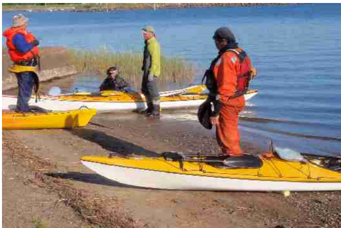
Sinivalkonauhamelojien vastaanotto Pursiseuran saunan rannassa 7.6.2010

Reissuista löytyy enempi: http://raahenpurjehdusseura.keskustelu.info/viewforum.php?f=13 .