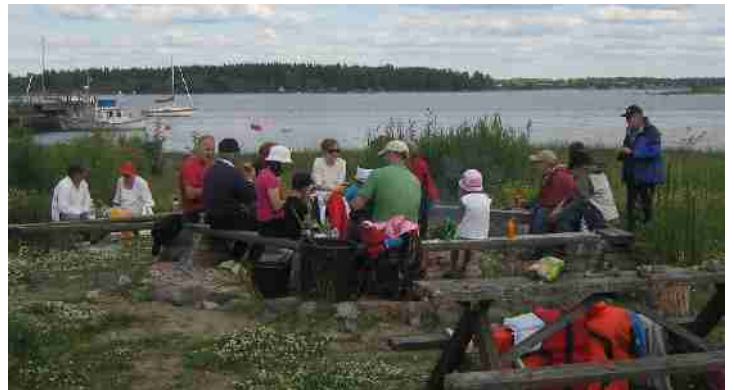
Juhannusaattona Iso-Kraaselissa makkaranpaistossa

Pekanpäiväeskaaderi järjestettiin perjantaina 2.7. Pikkulahdella useiden köliveneiden ja jollien voimin.