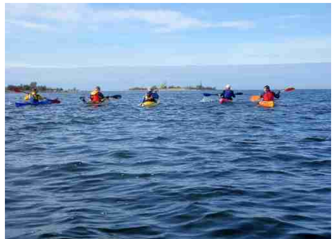
Tasku-Kalla tourinki 5.9.2010. Edessä hämöttää Tasku.

Merellä yhteinen melontakausi alkoi toukokuulla kahden päivän reissulla Rahjan saaristossa. Yhden yön reissut ovat hyvää treenausta kajakkiretkeilyyn. Kajakkiin, kun tulee saada pakatuksi oikein muonat, juomat ja varusteet. Syyskuun alussa Raahen edustalla Tasku-Kalla touringilla oli mukana toistakymmentä kajakkia! Matka ei ollut pitkä, mutta melottaessa etäämmällä rannoista ryhmässä melominen tuo lisäturvallisuutta ja isommassa porukassa kukin voi toinen toiselta oppia uutta melonnasta, retkeilystä, luonnosta tai mistä milloinkin. Mielenkiintoinen ja monipuolinen melontareitti oli syyskuun alussa melottu reissu Raahesta Siniluodon vesistön kautta Piehinkijoen suulle ja sieltä takaisin Raahen. Reitti sopii hyvin myös vähemmän meloneille.