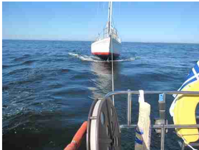
Mymlan II tulee Marjaniemestä

Purjehduskausi alkoi vesille laskuilla toukokuun loppupuolella. Jo ensimmäinen keskiviikkokisa pidettiin 9.6. ja keskiviikkokisat olivat kuluneena kesänä suosittuja osanottajamääriin nähden. Purjehdussäät olivat aurinkoisia, mutta tuulet pakkasiva toisinaan moijaamaan, kuten kävi eräällä Marjaniemen reissullakin. Pääasiassa matkapurjehtijat seilasivat tuttuja Perämeren vesiä yksin ja pienissä ryhmissä. Kesä veneilijäin näkövinkkelistä tuntui oikein kesältä, sillä pitkästä aikaa lämmintä ja aurinkoa riitti kuten ainakin. Osallistuttiin keskiviikkokisojen lisäksi seuran varsinaisiin kilpailuihin aktiivisesti sekä vuosikilpailuun. Purjehduskausi päättyi pääasiassa veneiden nostoon syyskuun lopussa, jolloin isot veneet nostettiin talvi-teloille.