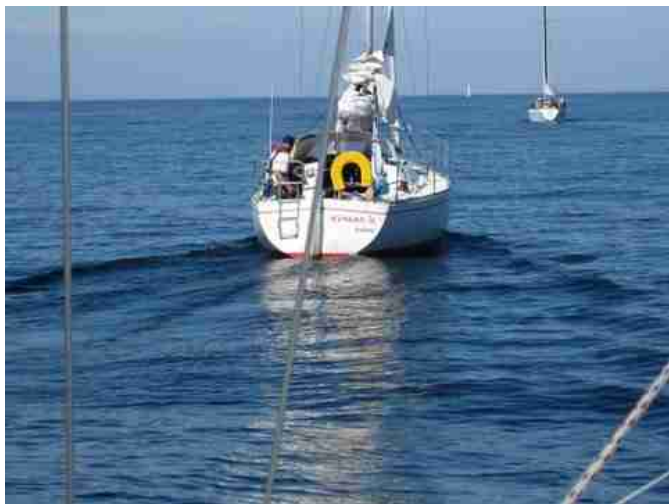
Mymlan II menee Marjaniemeen