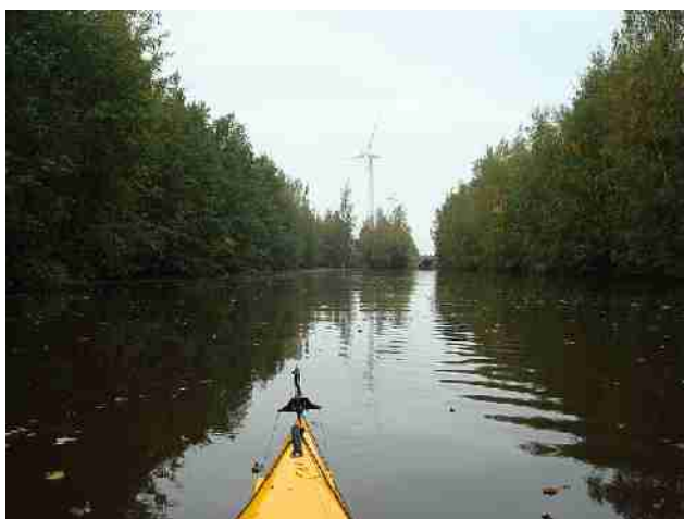
Rautaruukin jäähdytysjärjestelmää Siniluodossa 12.09.2010

Raahen tienoolla järjestettyihin kahteen melontatapahtumaan; Pyhäjokimelontaan ja Siikajokimelontaan oli mukavasti osallistujia, mikä hyvä asia ajatellen paikallisten tapahtumien jatkumoa. Raahen sopisi myös merimelontatapahtuma, kun on tuo meri tuossa vieressä :)