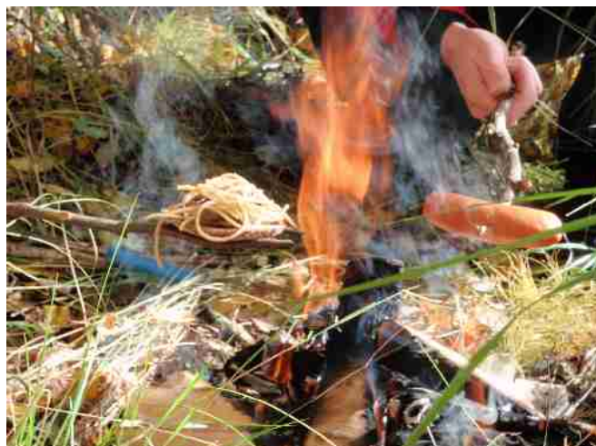
Herkuttelua Lamujoella 26.09.2010

Uimahallitoiminta on mahdollistanut melontaharrastuksen jatkamisen läpi vuoden. Mennyt talvi, kuten meneillään olevana jääkautena olemme harjoitelleet hallilla melonnan niksejä. Uimahallitoiminta on ollut hyvin pitkälti omatoimista harjoittelua hyvässä seurassa. Hallilla harjoitellaan mm. erilaisia eskimopyörähdyksiä sekä tuentoja. Toistoilla on tavoitteena saada nämä onnistumaan tosipaikan tullen. Retki- ja merikajakeilla harjoitellaan lisäksi reskutuksia (pelastautumista takaisin kajakiin kaatumisen jälkeen). Näiden harjoitusten tavoitteena on edistää melontareissujen turvallisuutta, parempaa kajakin hallintaa