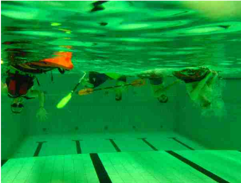
Uimahallilla keväällä 2010.

Tuleva melontakausi on parhaillaan menossa uimahallitoiminnan merkeissä. Lauantai-illan vuoron lisäksi olemme saaneet käyttöön myös vuoron sunnuntai-illan. Tälle vuorolle on suunnitteilla järjestää ”Ens-kertalaisten vuoro”. Siellä on tavoitteena opastaa ja kertoa melonnan alkuvedoilla oleville melonnan perusasioita. Uimahallivuorot, niin lauantain – ja sunnuntain vuorot ovat avoimia kaikille, mukaan toivotaankin uusia lajin harrastajia.